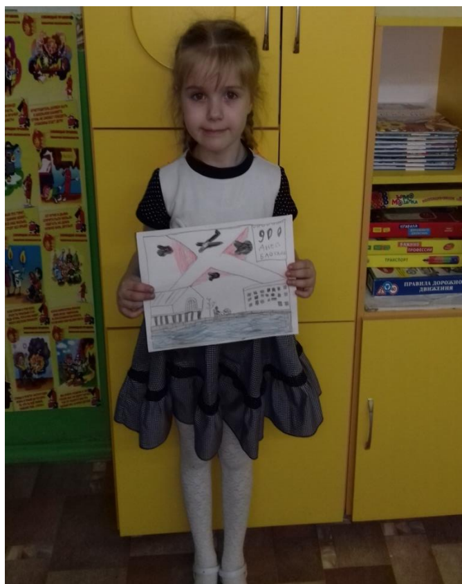
Рисунки на выставку.